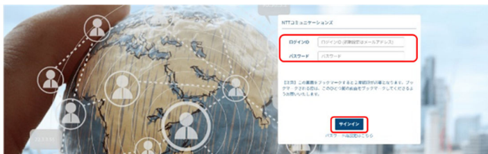
ビジネスポータル ログイン画面